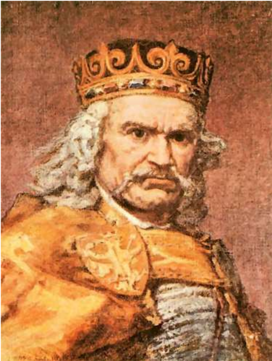
1831 – Провозглашение вечного нейтралитета Бельгии